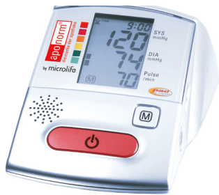
apornorm® Basis Voice