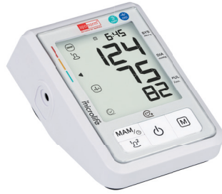
apornorm® Basis Control PLUS