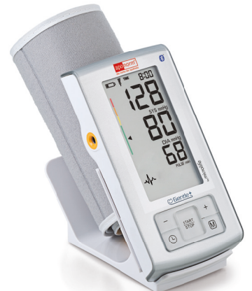
apornorm® Basis Plus Bluetooth®