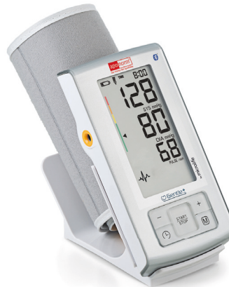
apornorm® Basis Plus