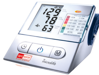
apornorm® Basis Plus