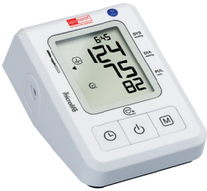
apornorm® Basis Control