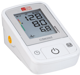
apornorm® Basis Control