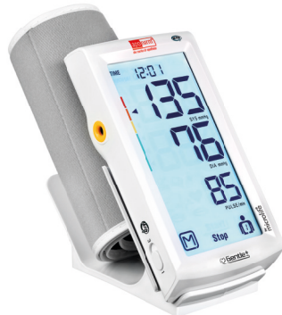
apornorm® Professional Touch