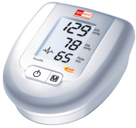
apornorm® Basis Control