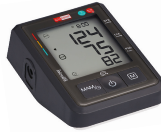
apornorm® Professional Control